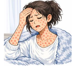
※イラストは文章生成AIにより作成