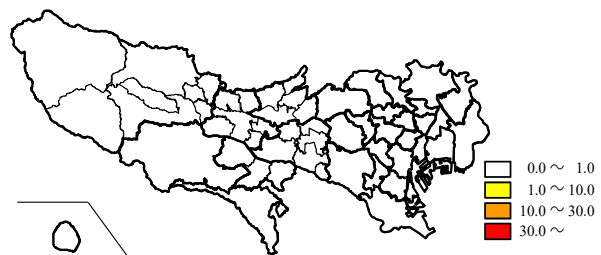
図2. 保健所別定点当たり患者報告数(42週)