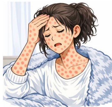
※イラストは文章生成AIにより作成