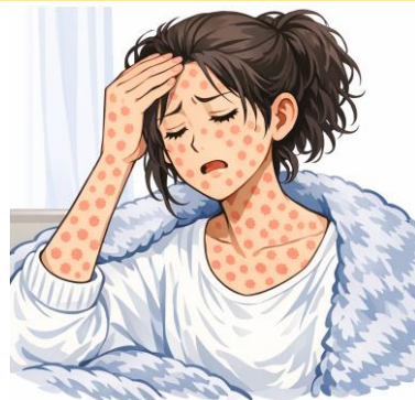
※생성형 AI로 제작한 일러스트입니다.