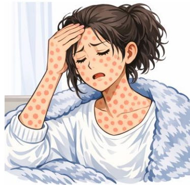
* Ang ilustrasyon na ito ay nilikha gamit ang text generation AI.