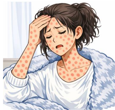
※示意圖由生成式 AI 製成